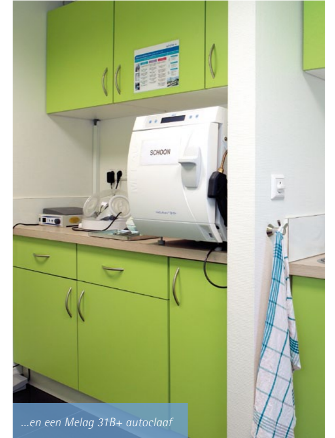
...en een Melag 31B+ autoclaaf