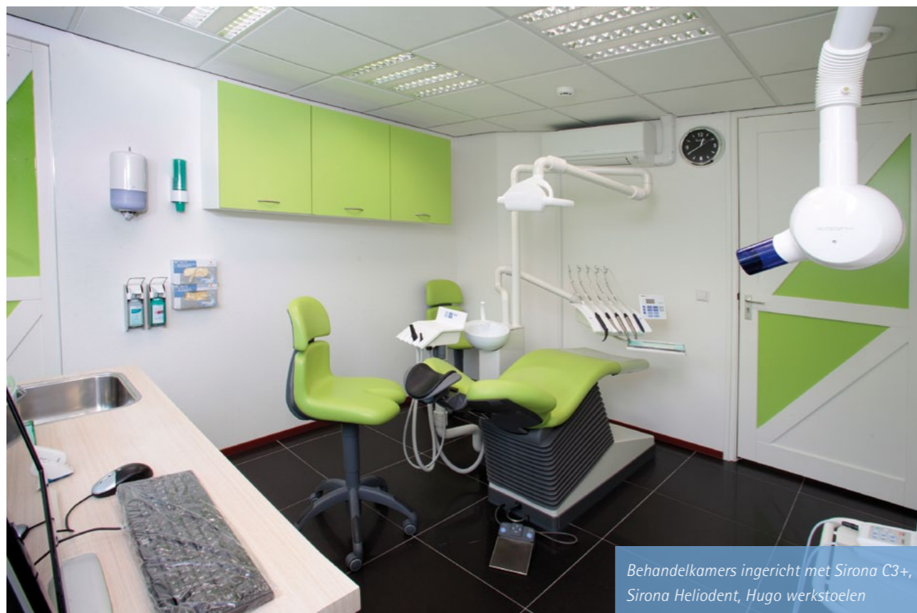
Behandeldkamers ingericht met Sirona C3+, Sirona Heliodent, Hugo werkstoelen