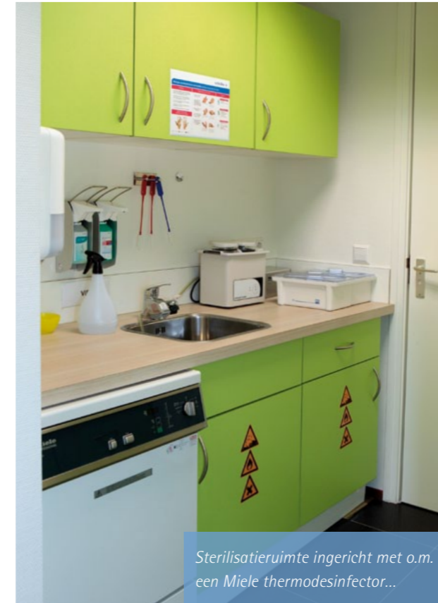
Sterilisatie ruimte ingericht met o.m. een Miele thermodesinfector...