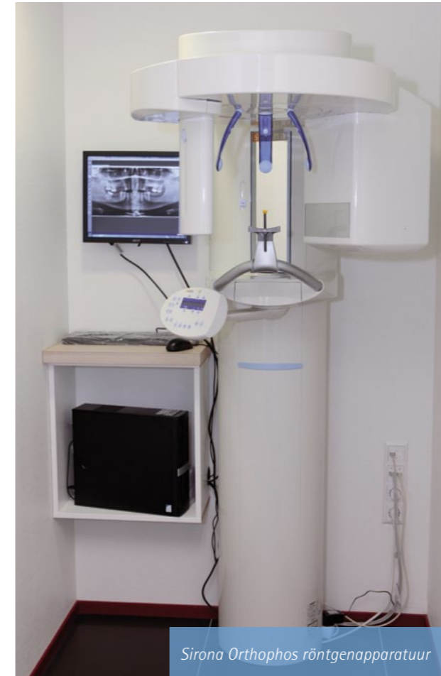
Sirona Orthophos röntgenapparatuur